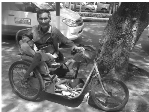
TB Lê Thi TĐ1/TQLC