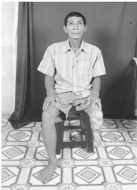
TB Mã Hòa TĐ7/TQLC